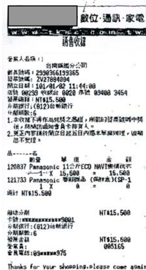
圖 1、3C 賣場出具之銷售收據範例

答：民眾申請補助所檢附之文件需符合購置節約能源補助作業要點第七點之規定，而此類"銷售收據"並不符合規定，請民眾回原購買經銷商處，請其開立統一發票或紙本電子發票後(需符合購置節約能源補助作業要點第七點第二項之規定)，始得進行申請。